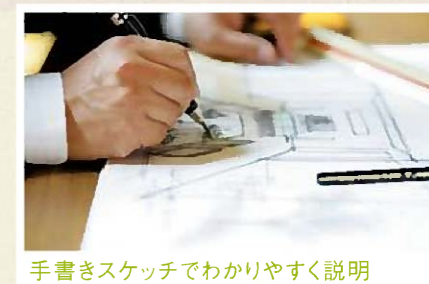
手書きスケッチでわかりやすく説明