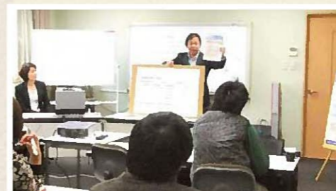
資金セミナーでは講師もやっています。