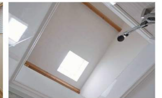
天井でひと続きになるLDKとバスルーム