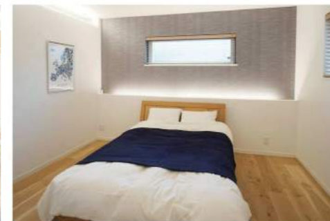
優れた換気システムでクリーンな毎日を