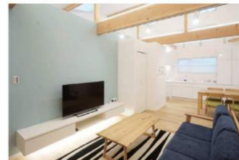
天井が高く開放的なリビングダイニング

汚れた空気やホコリなどは下に溜まり やすいため、排気口はすべて床に設置。 空気はクリーン。赤ちゃんも、安心して ハイハイできますよ。