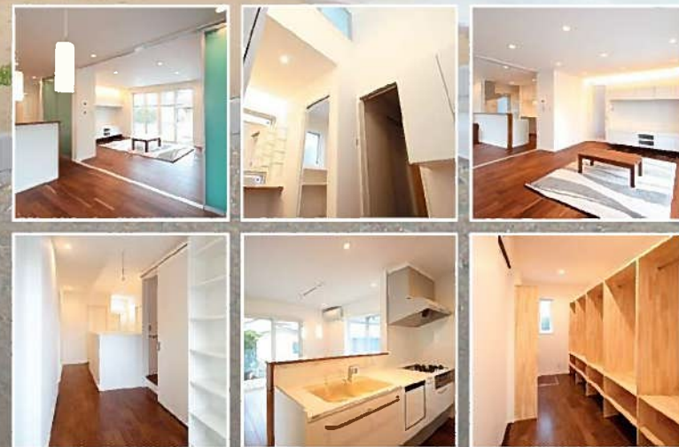
1F面積:108.55㎡(32.83坪) 2F面積:74.11㎡(22.41坪) 延床面積:182.66㎡(55.24坪) 敷地面積:319.46㎡(96.63坪)